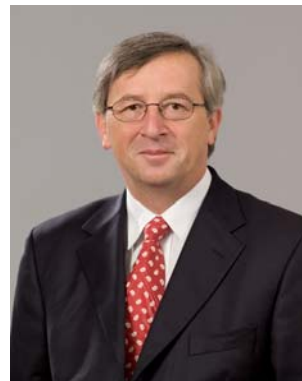
Jean-Claude Juncker Premier Ministre

Quand on évoque le dialogue social au Luxembourg, le « modèle luxembourgeois », les références clés proviennent inévitablement du temps de la crise de l'industrie sidérurgique dans les années 1970 et 1980. Les fondations de la concertation tripartite, rassemblant partenaires sociaux et pouvoirs publics, remontent pourtant bien au-delà. Si le modèle luxembourgeois est venu à maturité dans les années de crise, les ponts nécessaires à cette action commune furent indéniablement construits bien avant. C'est vrai pour la constitution des chambres professionnelles dans les années 1920. C'est vrai aussi pour la création du Conseil économique et social en 1966.