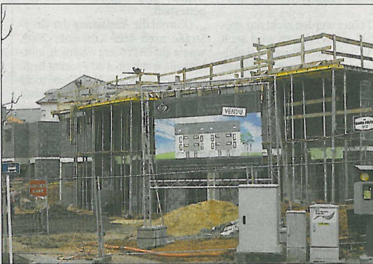
Die Prüfer des Rechnungshofs wunderten sich über „unangebrachte Ausgaben“ beim „Fonds du logement“.

Die Präsidentin der Kontrollkommission, Anne Brasseur (DP), erklärte gegenüber dem LW, dass die Kommission sich in den nächsten Wochen eingehend mit den Bemerkungen und Empfehlungen des Rechnungshofs auseinandersetzen wird. „Es gilt grundsätzliche Fragen zu klären“, sagte Brasseur und meint den Freiraum, den öffentliche Einrichtungen gegenüber staatlichen Verwaltungen genießen. Die Abgeordneten wollen die Einrichtungen „genau unter die Lupe nehmen“. Bei einigen „Etablissements publics“ besteht der Verdacht, dass die Verantwortlichen über die eigentliche Mission der Einrichtung hinausgehen. Erstaunt zeigte sich ein Kommissionsmitglied nicht zuletzt